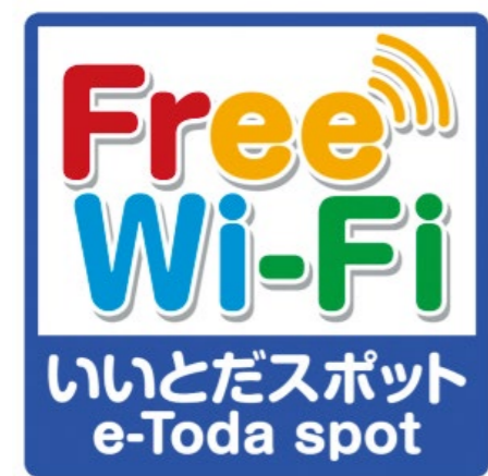
▲いとだスポットの目印となるロゴ