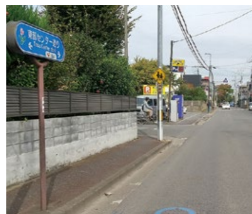
▲道路愛称変更を求める意見がある「東部センター通り」

議員 専門性のある大学などに協力いただき、ボランティアの指導者派遣に取り組む考えはないか。 教育部長 教育委員会では、「戸田市部活動方針」を全国に先駆けて作成し、先進的な自治体として